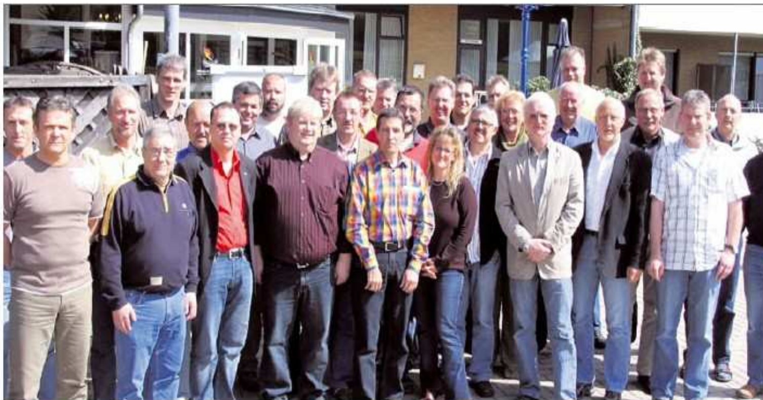
Vernetzt: Die Arbeitskreis-Mitglieder vertreten über 35 000 Arbeitnehmer in den Betrieben.

Und dieses Netzwerk soll auf ganz Europa ausgedehnt wer-